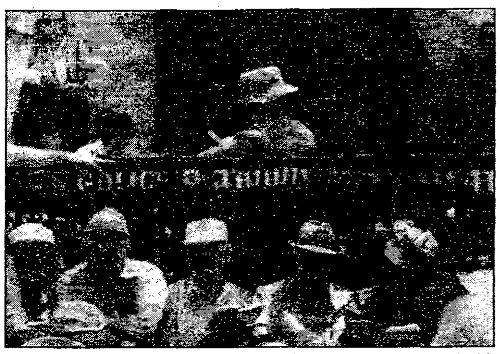
أعضاء جماعة - أبناء جبل الهيكل قرب بوابة الحرم القدسي

عبرت الأوساط السياسية والديبلوماسية الفلسطينية عن استنكارها وسخطها الشديد في اعقاب السماح للشرطة الإسرائيلية للعشرات من المتطرفين اليهود من اقتحام حركتي ما يسمى إمامة جبل الهيكل، وحق وقسم من الدخول إلى الحرم القدسي الشريف تنفيذا لقرار المحكمة العليا الإسرائيلية بهذا الشأن، حيث وقعت شهادات واشتباكات بين أهالي بيت المقدس الذين توافدوا إلى الأقصى للدفاع عنه.